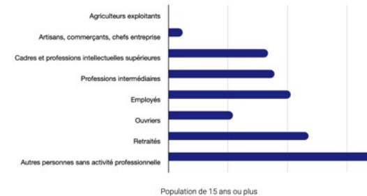
Population par catégorie socioprofessionnelle